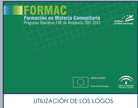
UTILIZACIÓN DE LOS LOGOS