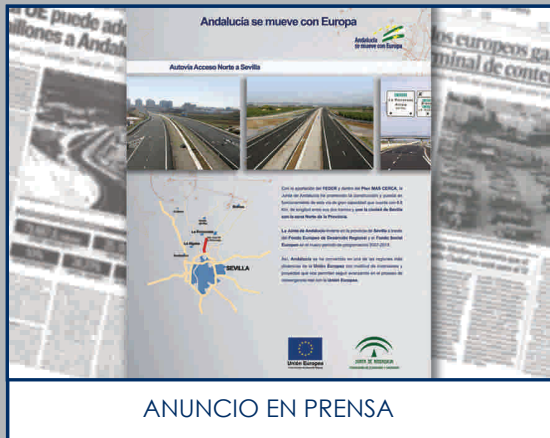
ANUNCIO EN PRENSA