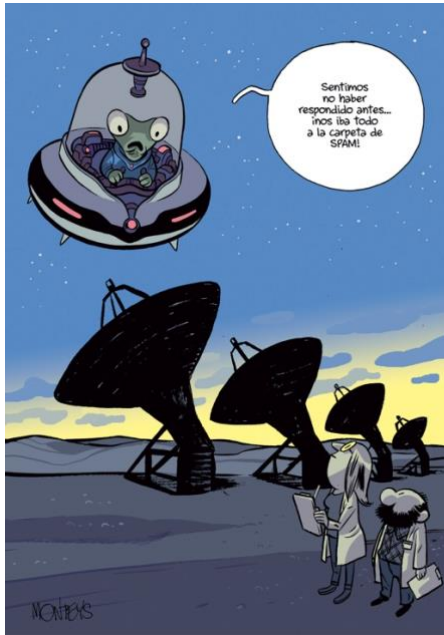
SETI (Búsqueda de Inteligencia Extraterrestre) Viñeta: Monteys / Concepto: Ángel Gómez Roldán

ConCienciaConHumor pretende contribuir a la divulgación científica por medio del humor gráfico. Para ello cuenta con la valiosa colaboración de más de 50 divulgadores y divulgadoras científicos de universidades y centros de investigación españoles que figuran entre los más relevantes del país, como Clara Grima, J.M. Mulet, Rosa Porcel, Teresa Valdés-Solís, Antonio Martínez Ron, Gemma del Caño o Javier Armentia, entre otros, que proponen una serie de conceptos científicos claves para estar bien informados; y con más de 90 viñetistas de reconocida trayectoria, como Albert Monteys, Atxe, Gallego y Rey, Sara Jotabé, Eneko, Marika Vila, Manel Fontdevila, Marilena Nardi o Peridis, entre otros, que los recrean en viñetas.