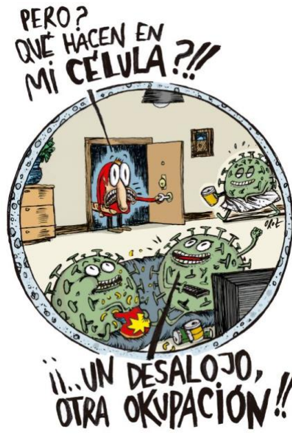
Virus Viñeta: Oroz / Concepto: Enrique Royuela

Las vacunas, la vida en otros planetas, el mito que dice que solo usamos el 10% de nuestro cerebro, los horóscopos, los agujeros negros, el blockchain , las enfermedades raras, el 5G... El objetivo de ConCienciaConHumor es comunicar conceptos científicos para acercar la ciencia al público general de forma amena, con rigor y con humor, y ayudar a fomentar el pensamiento crítico en nuestro día a día. Las viñetas repasan y explican conceptos que los divulgadores y divulgadoras consideran claves en ámbitos como la física, la química, las matemáticas, la astronomía, astrofísica, genética, biología, neurociencia... y, a la vez, desmontan mitos pseudocientíficos, bulos y negacionismos.