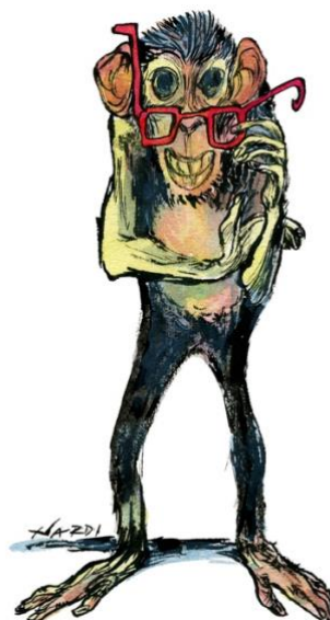
No descendemos del mono, somos monos Viñeta: Marilena Nardi / Concepto: Enrique Baquedano

La desinformación es un peligro que nos hace más vulnerables al engaño y que en ámbitos como el de la salud, entre otros, puede conllevar riesgos importantes. Una forma de combatir la desinformación es la divulgación, porque pone al alcance del público general conceptos científicos clave para estar bien informados y fomentar el pensamiento crítico. Si, además, la divulgación se combina con el humor (gráfico, en este caso), su alcance puede verse maximizado.