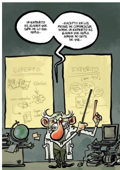
«De eso, yo no soy experto» Viñeta: Kap / Concepto: Pampa García Molina

En el último año y medio largo, pandemia mediante, se ha hecho aún más evidente la distancia que existe entre un sector de la población y la ciencia. A partir de marzo de 2020 empezamos a descubrir en nuestro entorno posturas negacionistas, ideas de curandero que circulaban por internet e incluso noticias falsas que generan y fomentan la desinformación entre la población.